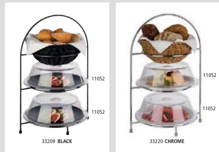
Präsentationsmöglichkeit presentation example passende Hauben suitable covers 11051, 11052