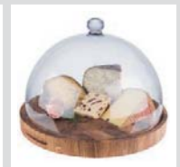
Präsentationsmöglichkeiten presentation examples