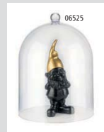
Präsentationsmöglichkeiten presentation examples